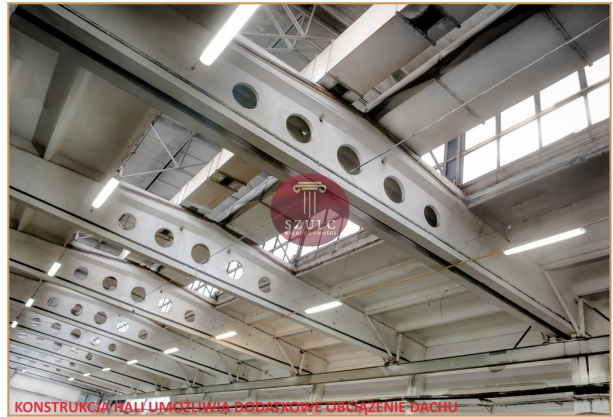
KONSTRUKCJA HALI UMOŻLIWIŁA DODATKOWE OBCIŻENIE DACHU