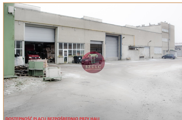
DOSTĘPNOŚĆ PLACU BEZPOŚREDNIO PRZY HALI