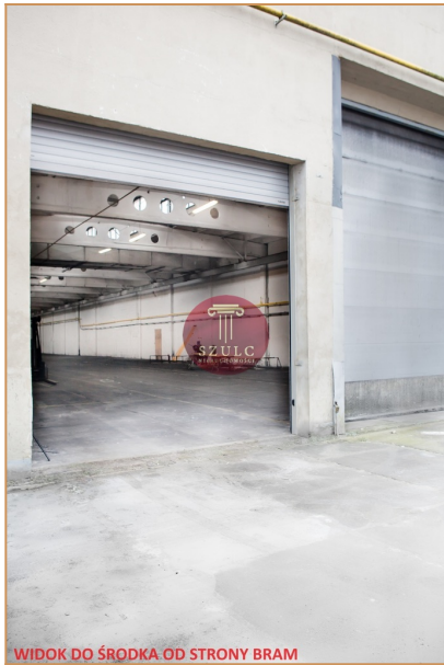
WIDOK DO ŚRODKA OD STRONY BRAM