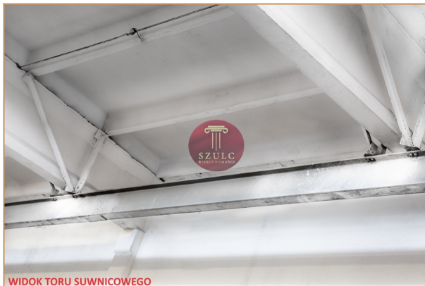
WIDOK TORU SUWNICOWEGO