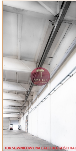
TOR SUWNICOWY NA CAŁEJ DŁUGOŚCI HALI