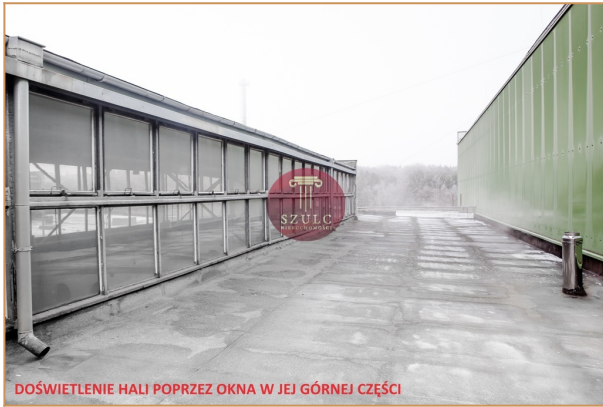
DOŚWIETLENIE HALI POPRZEC OKNA W JEJ GÓRNEJ CZĘŚCI