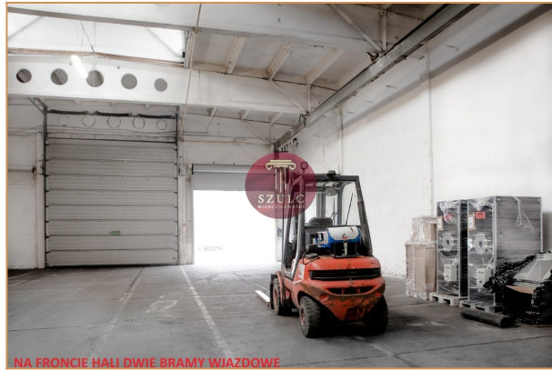
NA FRONCIE HALI DWIE BRAMY WIĄZDOWE